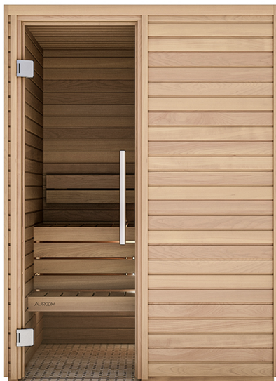
Modell 120 x 150 cm